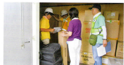
防災倉庫内備品搬出

前年度から防災訓練を2会場で開催しています。各会場で防災備品の搬出、AED体験や仮設トイレ作り、水消火器訓練、防災かるた取りなど様々な体験をしました。いざという時のために訓練が少しでも役に立つといいです。