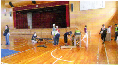
ストレッチャー組み立て