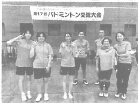
【参加した選手の皆さん】