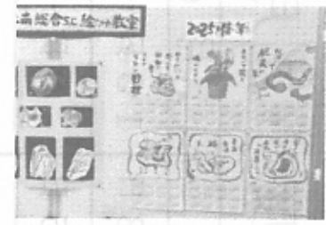
【文化展 会場の様子】