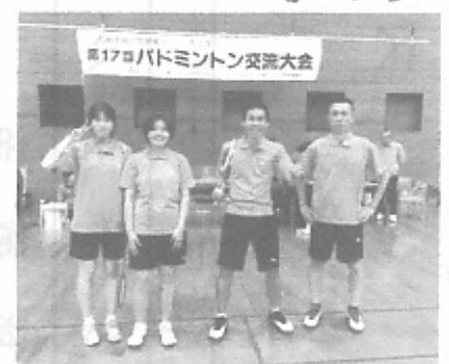
【参加した選手の皆さん】