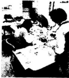
【 教室の様子 】