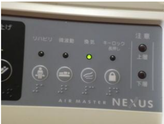
介護ベッドのスイッチ(1 2 3 4)