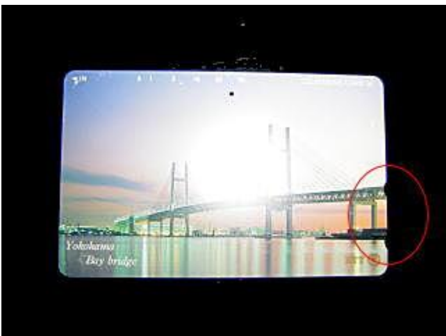
テレホンカード(切り欠き 2箇所)