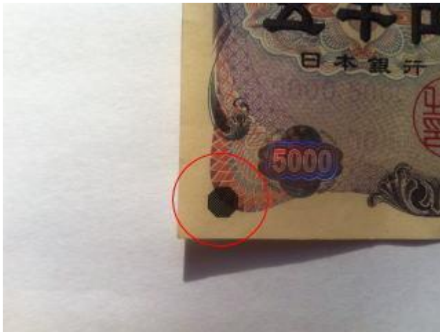
五千円札(左下の八角形)