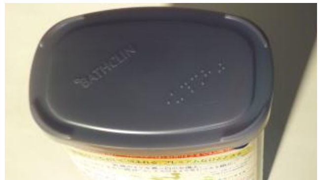
入浴剤(バスクリン) バスクリン