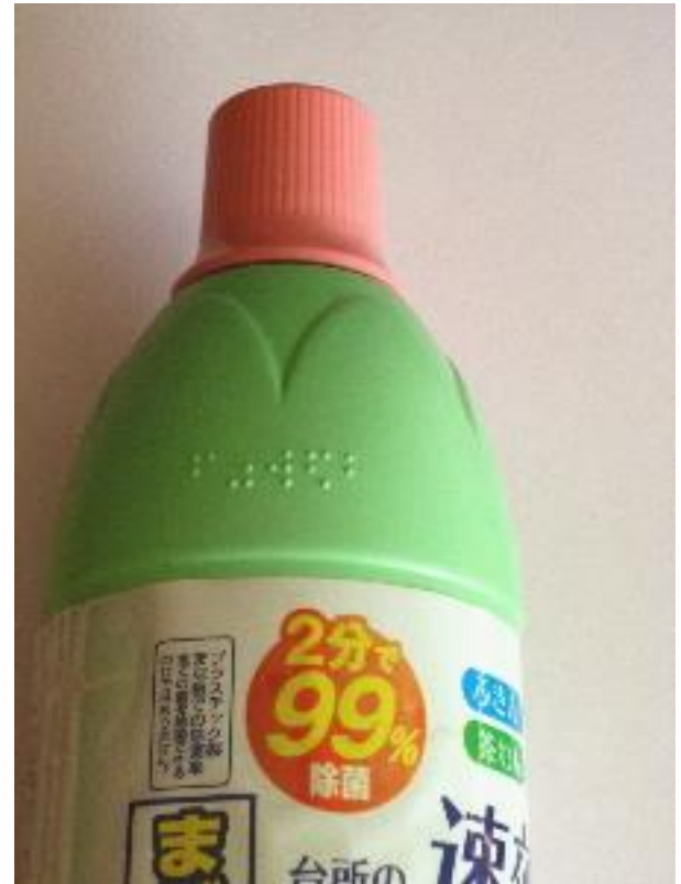
漂白剤(エンソケイ)