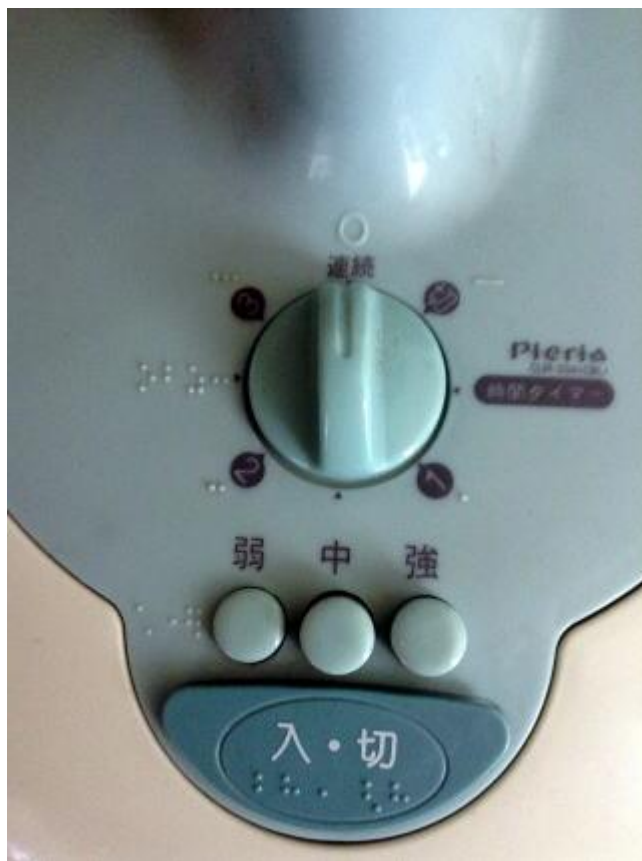
扇風機のスイッチ(タイマー カゼ イリ キリなど) (ドウシシャ)