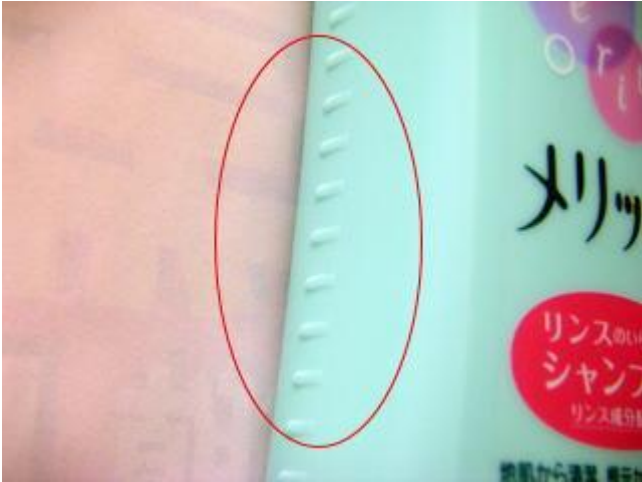
シャンプー(ボトルの横の横線) リンスと区別するためにあります