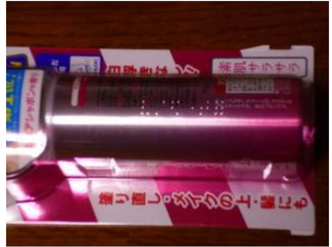
日焼け止めスプレー(ヒヤケドメ) コーセー