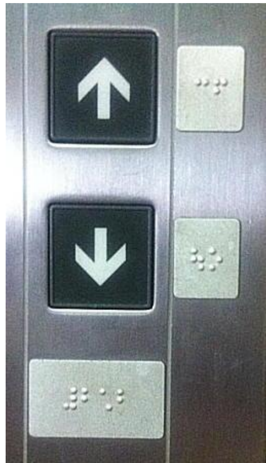
エレベーター(ウエ シタ 階数)