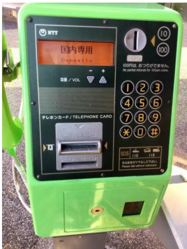
公衆電話(コイン カード イリグチ カード デグチ)