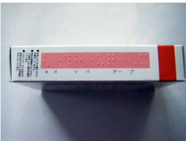
キズリバテープ(キズリバテープ) 共立薬品