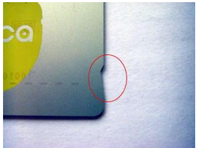
マナカ(切り欠き 1箇所)