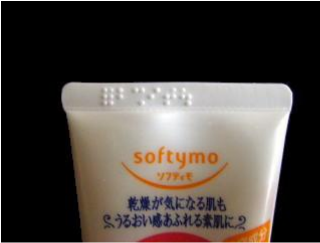
メイクおとし(メイクオトシ) コーセー