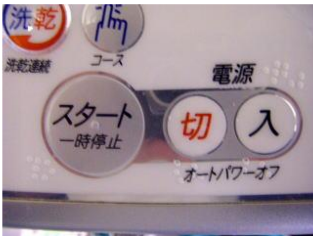
洗濯機のスイッチ(スタ イリ キリ デン)