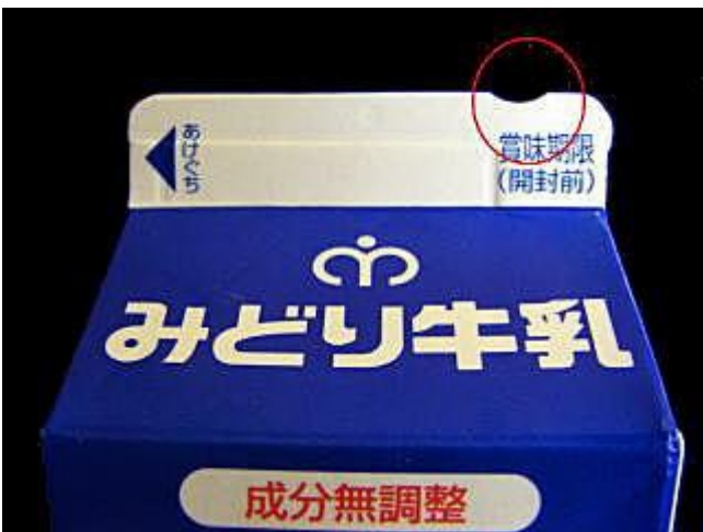
牛乳パック(切り欠き 1箇所) 成分無調整牛乳だけにあります