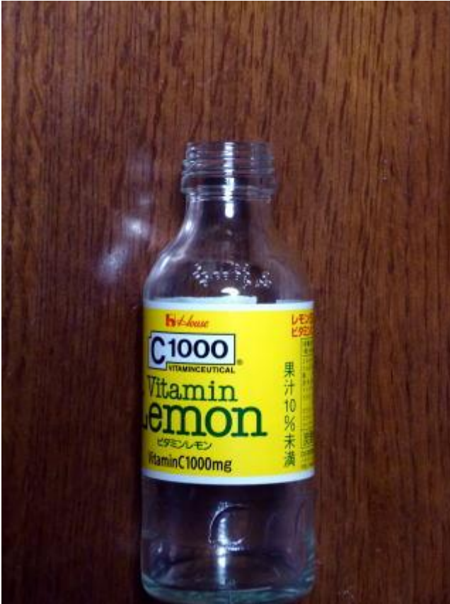
C1000(シーセン レモン) ハウスウェルネスフーズ