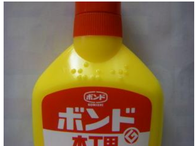
ボンド(モッコヨー ボンド) コニシ